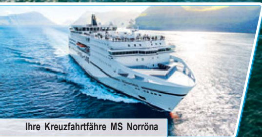
Ihre Kreuzfahrtfähre MS Norröna

Erlebnis-Paket mit 4 Ausflügen, Halbpension & Getränkepaket Unterhaltungsprogramm an Bord Panoramafahrten auf den Färöer-Inseln und auf Island