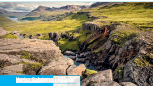
Herbe Schönheit Islands