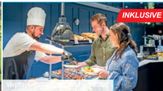
Verpflegungspaket mit Wikinger-Büfett