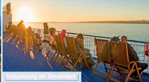
Entspannung am Sonnendeck