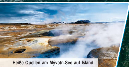
Heiße Quellen am Mývatn-See auf Island