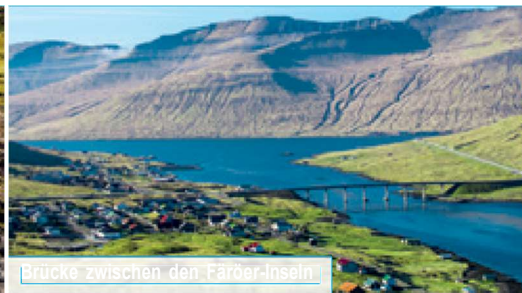
Brücke zwischen den Färöer-Inseln