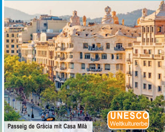
Passeig de Gràcia mit Casa Milà