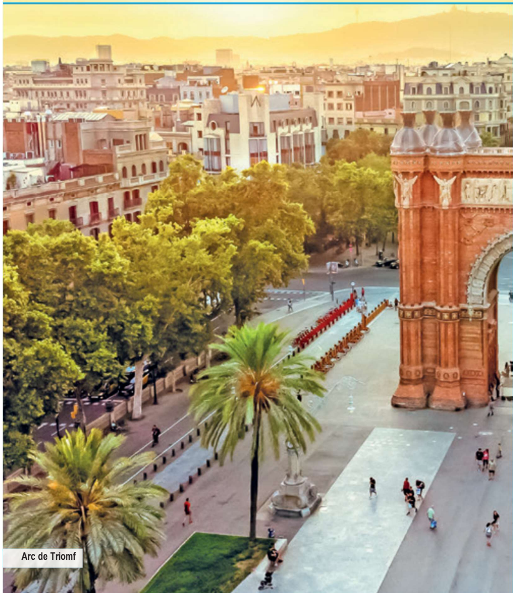
Arc de Triomf

Tag 3: Heute erkunden Sie Barcelona zu Fuß. Sie starten bequem direkt von Ihrem zentralen Stadthotel Evenia Roselló und schlendern zum Boulevard Passeig de Gràcia, der für seine prachtvollen Gebäude im Modernisme-Stil berühmt ist. Sie sehen die Casa Batlló und Casa Milà, beides