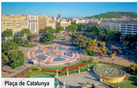
Plaça de Catalunya