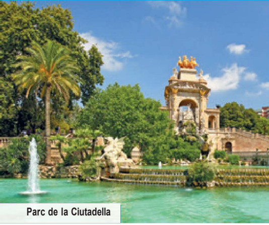
Parc de la Ciutadella

Ein schier unmögliches Unterfangen ist es, Barcelona in seiner Gesamtheit zu begreifen. Doch darum geht es auch gar nicht: Bei unserem neuen Städte-Erlebnis nach Barcelona werden Sie von den Wellen der Freude mitgerissen, die täglich an die Strände der Weltstadt gespült werden. Tagtäglich werden hier