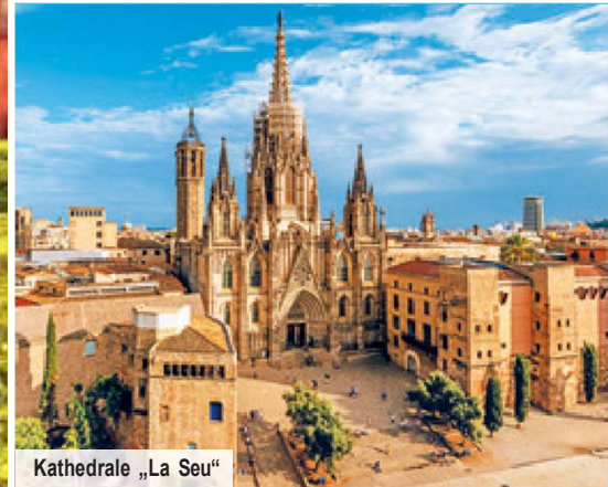
Kathedrale „La Seu“