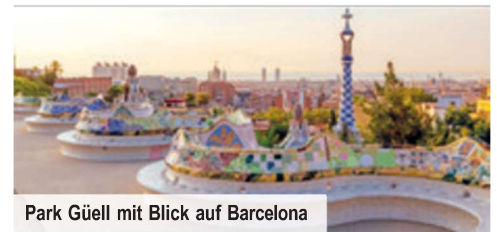
Park Güell mit Blick auf Barcelona

Für Alleinreisende ½ Doppelzimmer (Zweibett) ohne Aufpreis Unterbringung mit einer Person gleichen Geschlechts Doppelzimmer zur Alleinbenutzung + € 85 p.N.