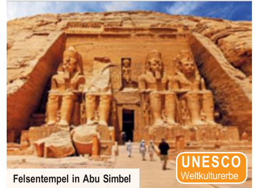
Felsentempel in Abu Simbel

Ausflug nach Abu Simbel (UNESCO-Weltkulturerbe) zu den einzigartigen Felsentempeln und Baudenkmalern der Antike zu Ehren Ramses II. und seiner Gemahlin Nefertari Bei Vorabbuchung 2024 € 119 p.P. Bei Vorabbuchung 2025 € 149 p.P.