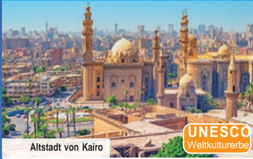
Altstadt von Kairo