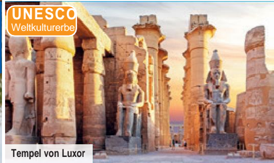
Tempel von Luxor