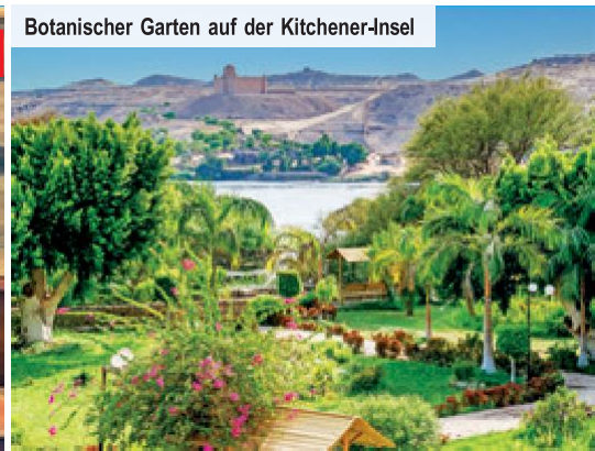
Botanischer Garten auf der Kitchener-Insel