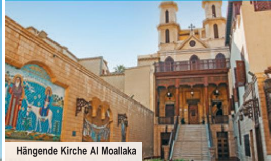
Hängende Kirche Al Moallaka

Erleben Sie das letzte Weltwunder der Antike, die beeindruckenden Pyramiden von Gizeh, sowie die imposanten Welterbe-Tempel Luxor & Karnak!