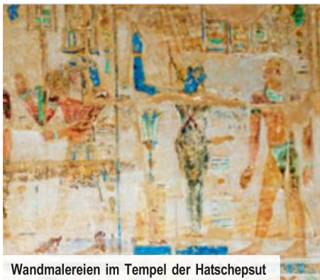
Wandmalereien im Tempel der Hatschepsut