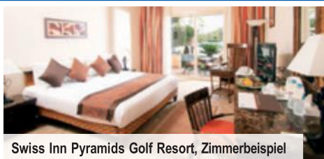
Swiss Inn Pyramids Golf Resort, Zimmerbeispiel