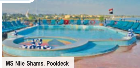
MS Nile Shams, Pooldeck