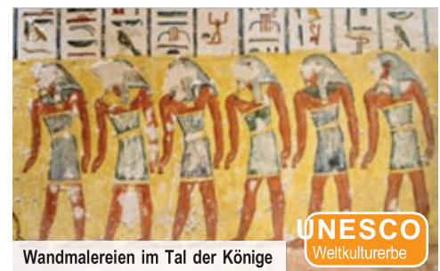
Wandmalereien im Tal der Könige