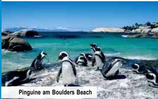
Pinguine am Boulders Beach