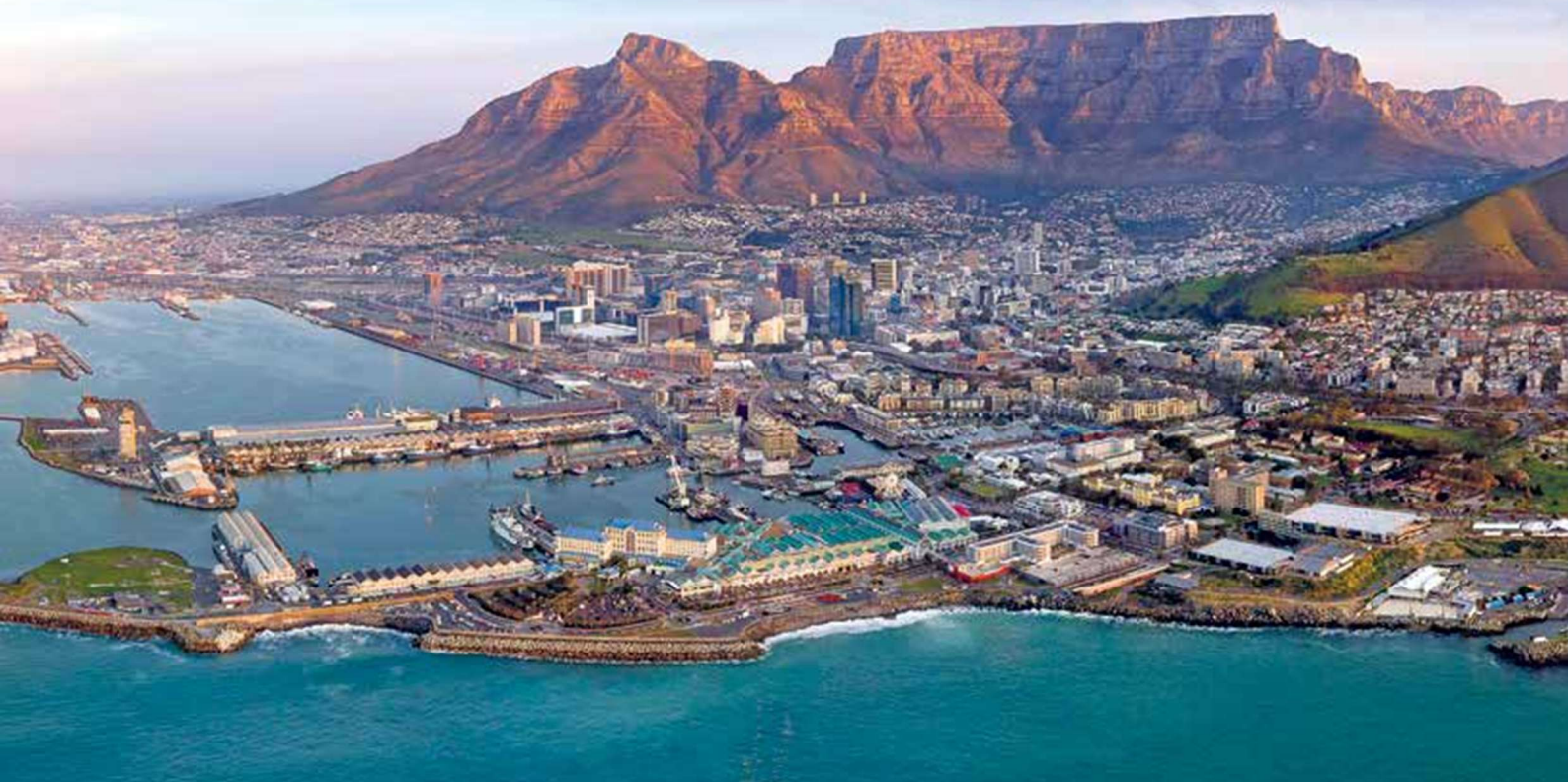
Blick auf Kapstadt