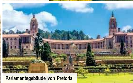
Parlamentsgebäude von Pretoria

kurze Wanderung durch das Naturreservat unternommen wird. Vor Ort genießen Sie auch das inkludierte Mittagessen. Das Abendessen erfolgt dann gemeinsam mit den anderen Reisegästen bei Buchung des Genusspakets in einem lokalen Restaurant an der Waterfront.