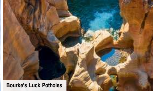
Bourke's Luck Potholes