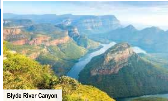
Blyde River Canyon