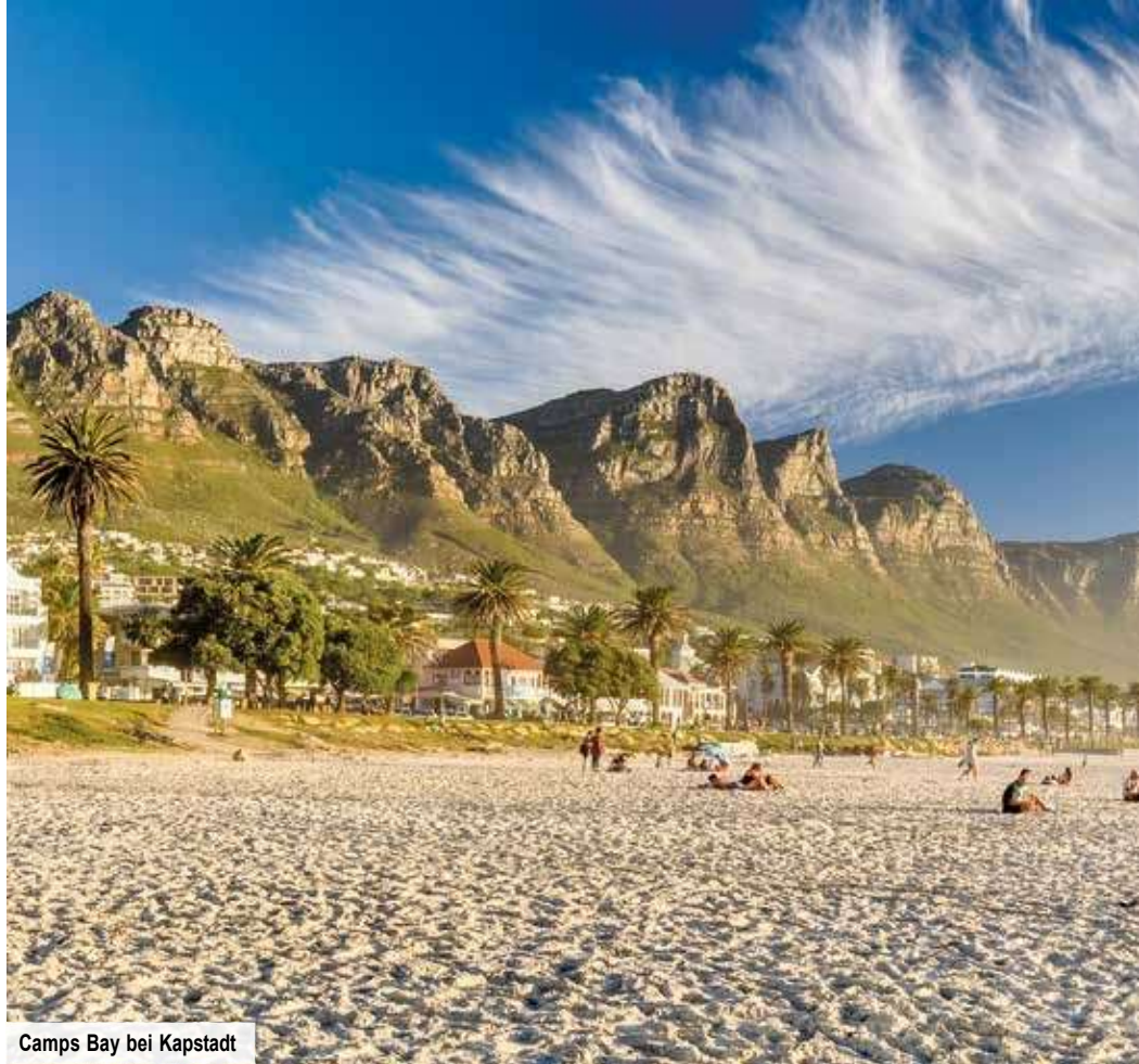
Camps Bay bei Kapstadt