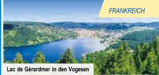
Lac de Gérardmer in den Vogesen