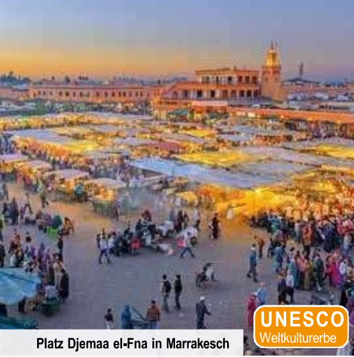
Platz Djemaa el-Fna in Marrakesch