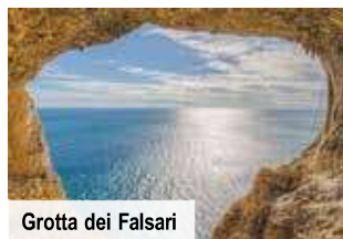
Grotta dei Falsari