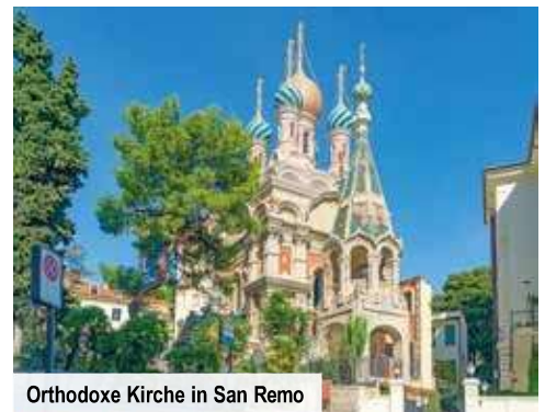
Orthodoxe Kirche in San Remo