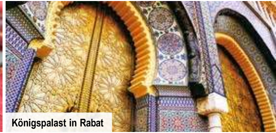
Königspalast in Rabat