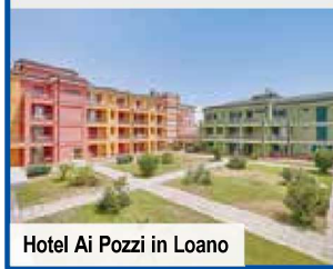
Hotel Ai Pozzi in Loano

Genießen Sie 5 Übernachtungen in Ihrem 4-Sterne-Hotel, dem Hotel Del Golfo in Finale Ligure, dem Hotel Lungomare in Andora oder dem Hotel Ai Pozzi in Loano. Ihr Hotel verfügt über Rezeption, Aufzug, Bar, WLAN und Restaurant. Untergebracht sind Sie im Doppelzimmer mit Bad oder Dusche/WC, Telefon, Sat-TV, WLAN, Safe und Mini-Bar.