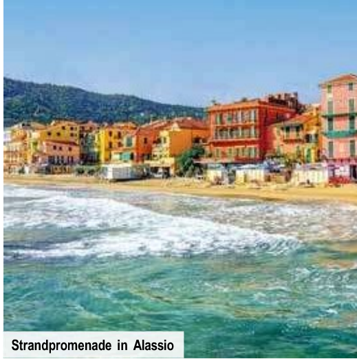
Strandpromenade in Alassio