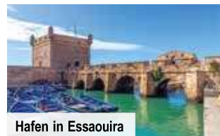
Hafen in Essaouira