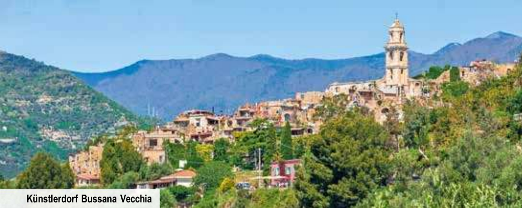
Künstlerdorf Bussana Vecchia