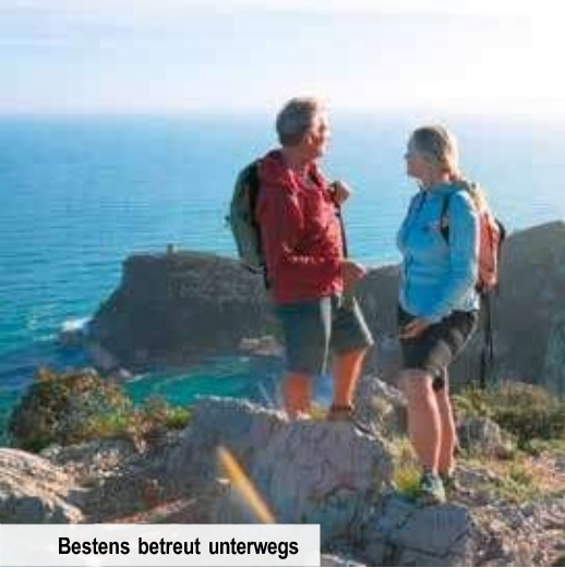
Bestens betreut unterwegs