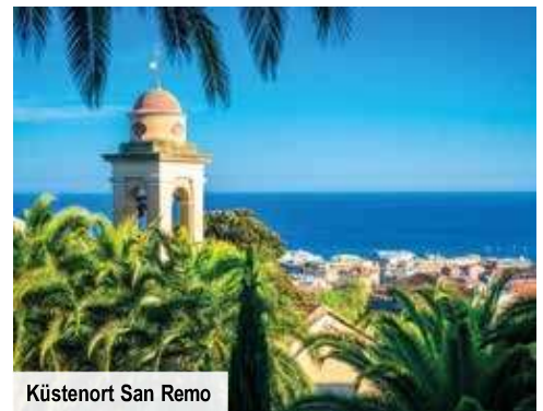
Küstenort San Remo

Ein weiteres Highlight der Strecke ist die direkt über dem Meer gelegene „ Grotta dei Falsari “. Die geheimnisvolle Höhle, die Sie sogar von innen gemeinsam mit Ihrem Wanderführer besichtigen, ist von vielen Legenden und Geschichten umwoben, was ihren Besuch besonders spannend macht. So wird beispielsweise erzählt, dass die Höhle einst von Schmugglern und Banditen als Versteck genutzt wurde. Schließlich erreichen Sie Noli . In dem malerischen Küstenort, der zur Vereinigung der schönsten Dörfer