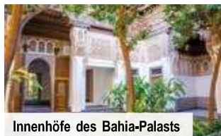
Innenhöfe des Bahia-Palasts