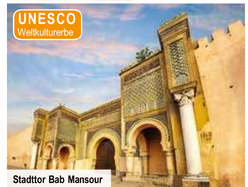
Stadttor Bab Mansour