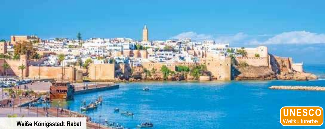
Weißer Königsstadt Rabat