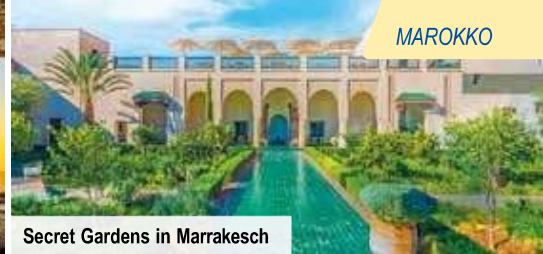
Secret Gardens in Marrakesch