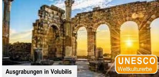
Ausgrabungen in Volubilis