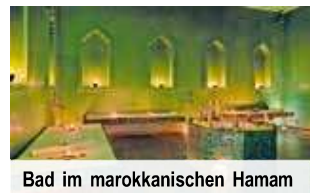
Bad im marokkanischen Hamam

Pflegeritual im marokkanischen Hamam (Tag 7) Finden Sie Ruhe und Entspannung beim traditionellen Baderitual (inklusive Transfer) Nur Vorabbuchung € 59 p. P.