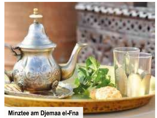
Minztee am Djemaa el-Fna