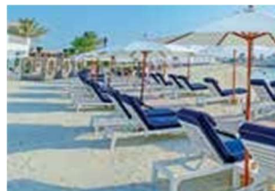
Zugang zum Solymar Beach Club

Gönnen Sie sich noch mehr Komfort: 5-Sterne-Hotel The Grove & Conference Centre mit exklusivem Zugang zum Solymar Beach Club Nur Vorabbuchung Doppelzimmer € 299 p. P. Einzelzimmer € 440 p. P.