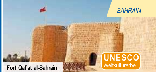
Fort Qal'at al-Bahrain