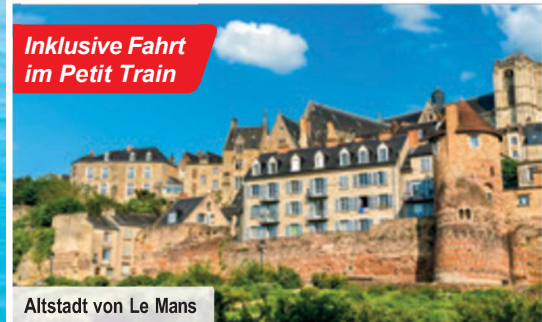
Altstadt von Le Mans