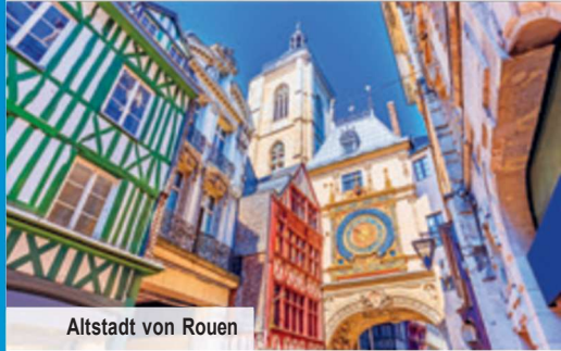
Altstadt von Rouen