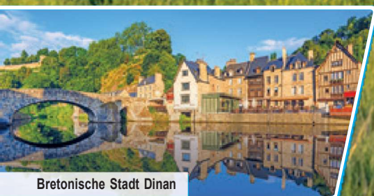
Bretonische Stadt Dinan