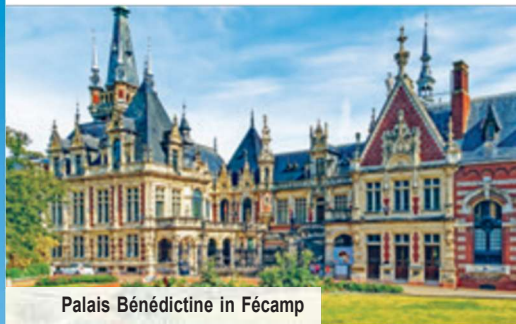
Palais Bénédicte in Fécamp