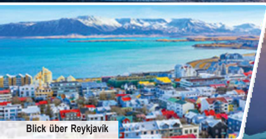
Blick über Reykjavik

Ausflugs- & Erlebnisprogramm mit 3 Ausflügen & Nordlichterjagd Exklusiver Willkommensabend mit Opernsängern Halbpension