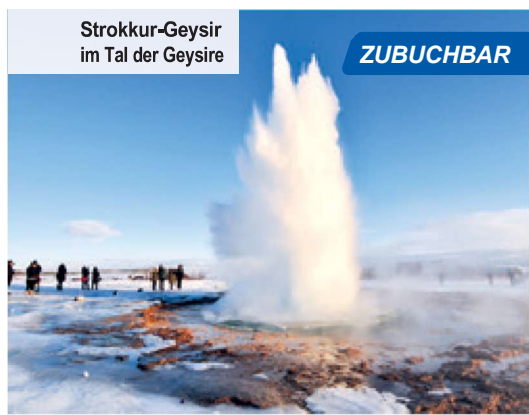
Strokkur-Geysir im Tal der Geysire

Heute fliegen Sie mit vielen schönen Erinnerungen zurück in die Heimat.