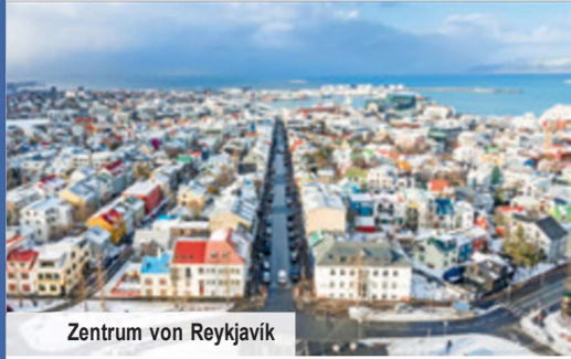
Zentrum von Reykjavík