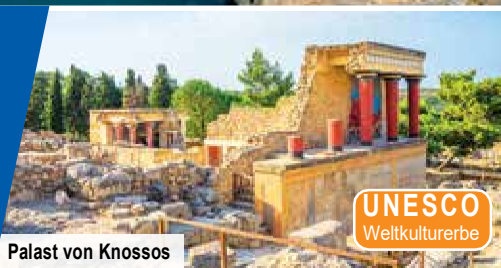
Palast von Knossos

Erlebnisprogramm mit UNESCO- Palast von Knossos, Thrapsano & Weinverkostung in Archanes