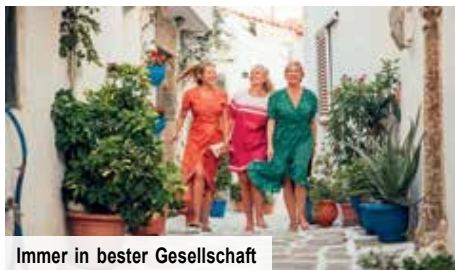
Immer in bester Gesellschaft

venezianischen Hafen und den im Jahre 1830 erbauten, mit 9 m Höhe zweitgrößten Leuchtturm der Insel. Sie sehen den Rimondi-Brunnen mit seinen drei Löwenköpfen und schlendern über den zentralen Mikrasiaton-Platz, bevor Sie bei freier Zeit die Städteperle genießen.