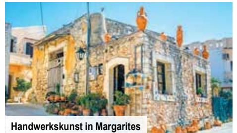
Handwerkskunst in Margarites

Auf einem Landgut zergehen Ihnen vorzügliche Weine auf der Zunge. Bei einer Verkostung des kretischen Tropfens spüren Sie die Seele der Insel, ihr kraftvoll pulsierendes Herz.