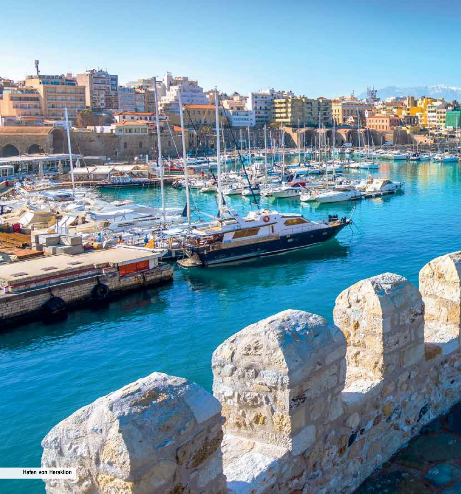
Hafen von Heraklion

Abgerundet wird das Erlebnisprogramm mit Erholung im 4-Sterne-Hotel und Genuss mit der Halbpension, einer Wein- sowie einer Olivenölverkostung. Freuen Sie sich auf einzigartige Erlebnisse und beste Erholung auf der Inselperle der Ägäis und lassen Sie sich wie Prinzessin Europa nach Kreta verführen!