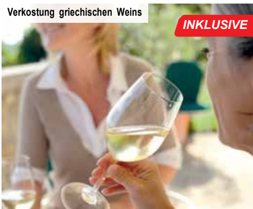
Verkostung griechischen Weins