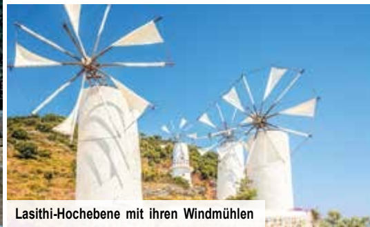
Lasithi-Hochebene mit ihren Windmühlen