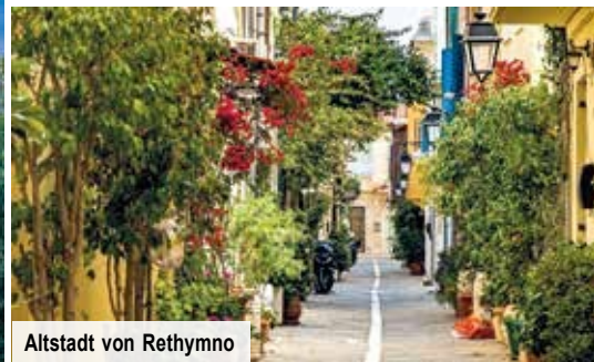
Altstadt von Rethymno