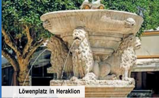
Löwenplatz in Heraklion