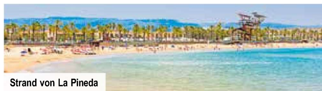
Strand von La Pineda

Ganztagesausflug nach Montserrat mit Besuch des berühmten Klosters Montserrat und seiner prächtigen Basilika inkl. Likörprobe € 79 p. P. Bei Vorabbuchung sparen Sie € 10 p. P. € 69 p. P.