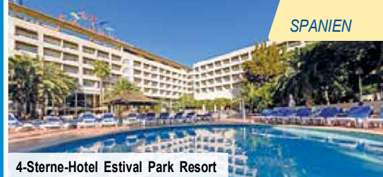
4-Sterne-Hotel Estival Park Resort