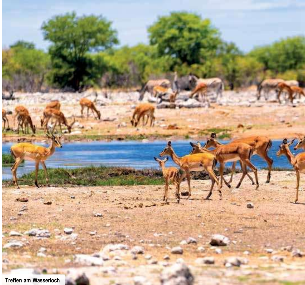
Treffen am Wasserloch

und fahren nach Swakopmund, wo Sie nicht nur zweimal übernachten, sondern auch einen geführten Rundgang erleben. Von der „Old Jetty“, dem Wahrzeichen der Stadt, haben Sie einen weiten Blick über das Wasser und die Küste! Erste von zwei Übernachtungen in Ihrem Hotel in Swakopmund. Bei Buchung des Erlebnispakets kehren Sie heute in einem örtlichen Restaurant ein.