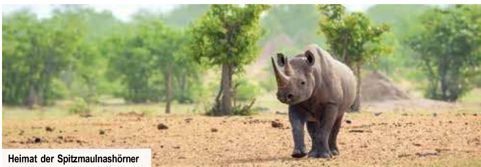
Heimat der Spitzmaulnashörner

Quadratkilometer große Park von einem 1.700 Kilometer langen Zaun umgeben.