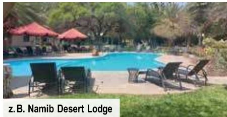
z. B. Namib Desert Lodge

Nächte in gut gelegenen Lodges in der Nähe der eindrucksvollen Nationalparks! Alle Lodges sind Teil der hervorragend bewerteten Godwana Collection.