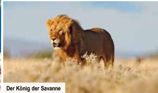
Der König der Savanne