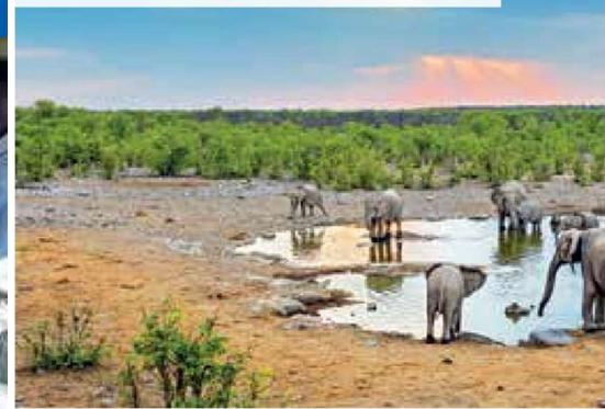
Elefanten am Wasserloch im Etosha-Nationalpark