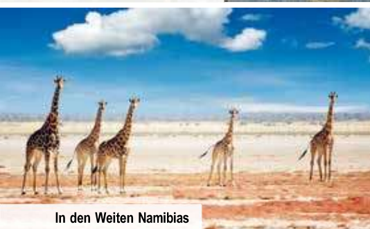
In den Weiten Namibias