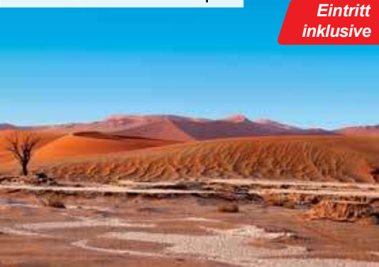
Sonnenuntergangstour in der Kalahari-Wüste