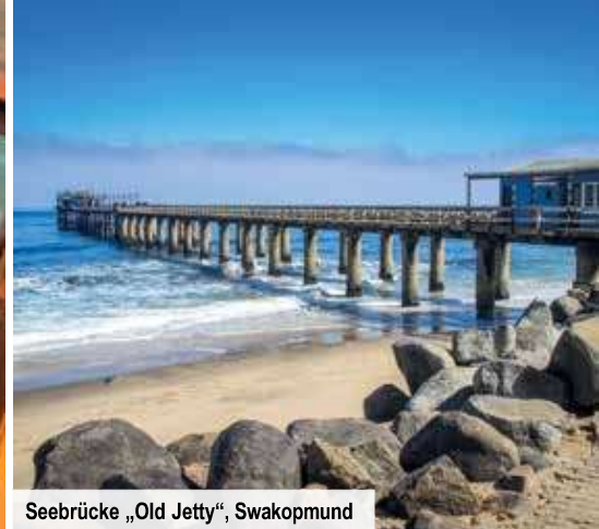
Seebrücke „Old Jetty“, Swakopmund

Wüste. Namib bedeutet so viel wie „große Leere“ und tatsächlich gibt es hier, anders als in der Halbwüste Kalahari, kaum Pflanzen. Die Namib teilt sich in zwei landschaftlich sehr gegensätzliche Regionen: Im Norden liegen schroffe Felsen und Schluchten, im Süden ein Meer von rötlichen Dünen, die wirken, als wären sie einem Fantasyfilm entnommen. Auf Ihrer Reise werden Sie dieses Naturwunder in seinem ganzen Facettenreichtum erleben!