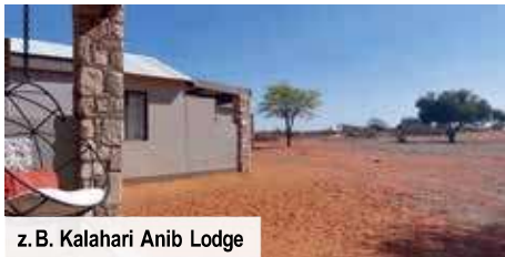
z. B. Kalahari Anib Lodge

Freuen Sie sich auf neun Übernachtungen während Ihrer Zeit in Namibia. Sie verbringen vier Nächte in guten Mittelklassehotels in Windhoek und Swakopmund und ganze fünf