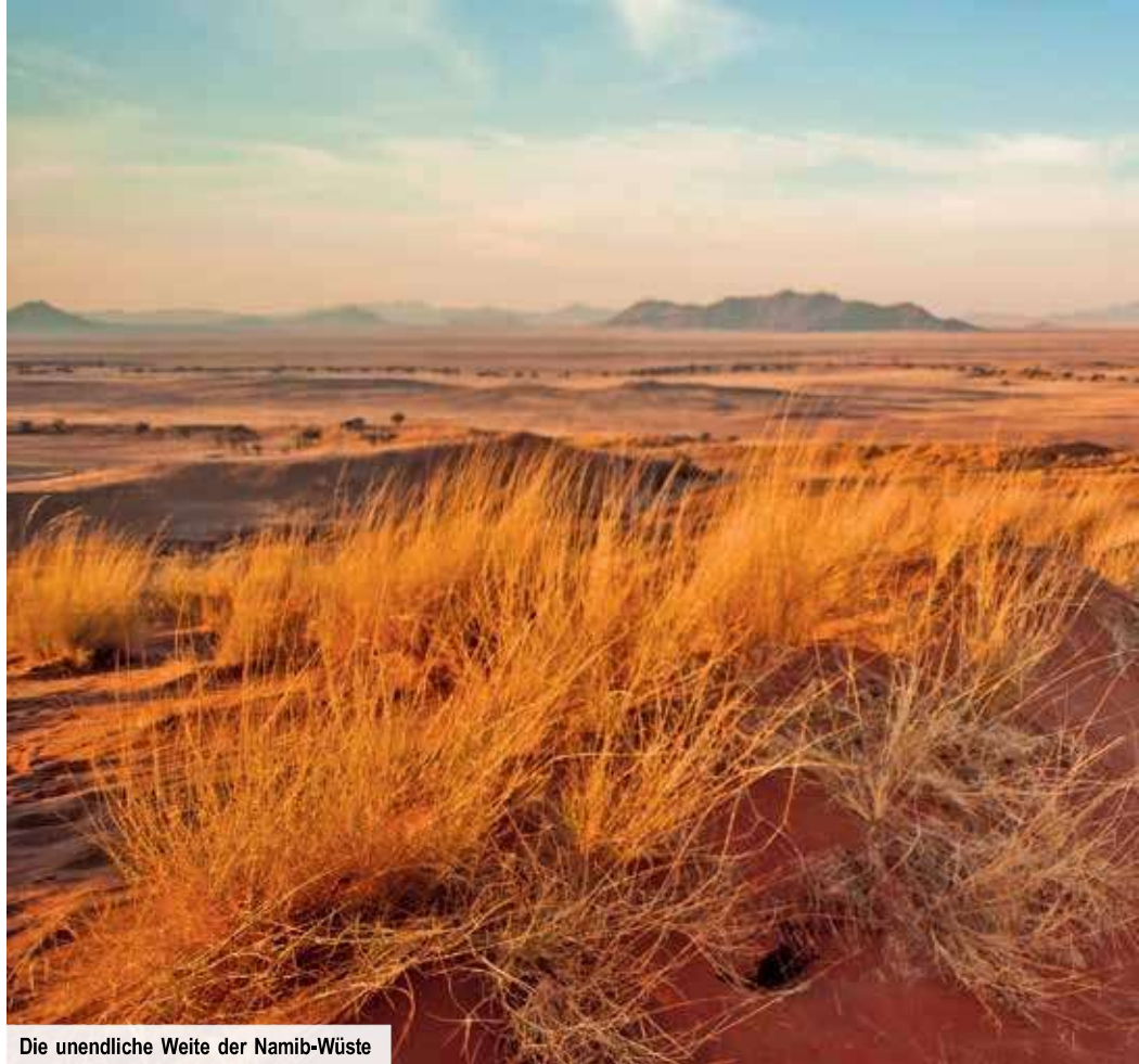
Die unendliche Weite der Namib-Wüste