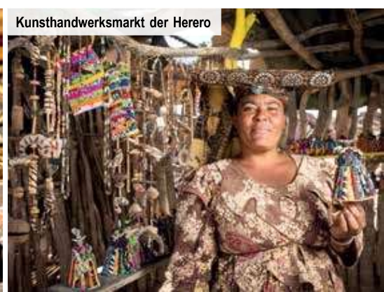
Kunsthandwerksmarkt der Herero