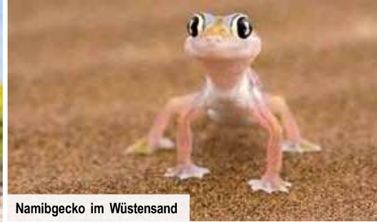
Namibigecko im Wüstensand

Freuen Sie sich auf unvergessliche Entdeckungen, faszinierende tierische Begegnungen, eindrucksvolle Panoramen und eine exklusive Pirschfahrt im Etosha-Nationalpark!