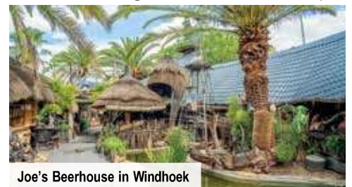
Joe's Beerhouse in Windhoek