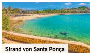
Strand von Santa Ponça