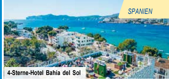
4-Sterne-Hotel Bahía del Sol