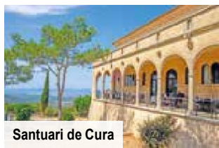
Santuari de Cura

Alle verfügbaren Reisetermine & Flughäfen finden Sie auf trendtours.de