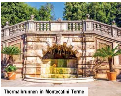
Thermalbrunnen in Montecatini Terme