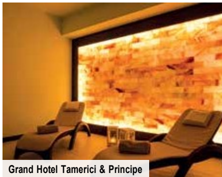
Grand Hotel Tamerici & Principe