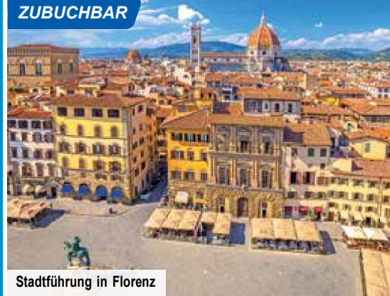
Stadtführung in Florenz