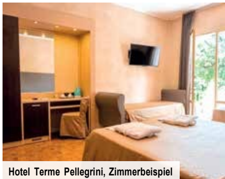
Hotel Terme Pellegrini, Zimmerbeispiel