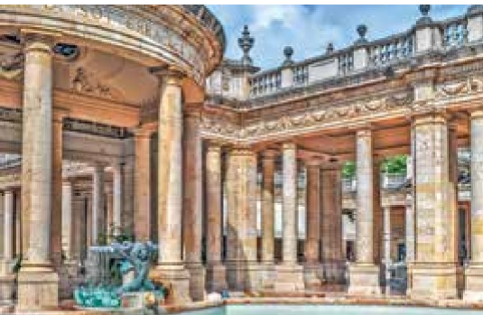
Terme Tettuccio in Montecatini