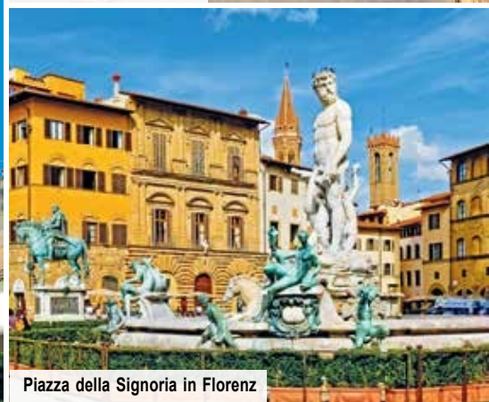
Piazza della Signoria in Florenz