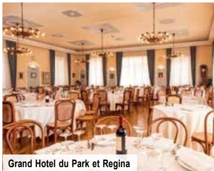
Grand Hotel du Park et Regina

Freuen Sie sich auf Ihr exklusives 4-Sterne-Hotel direkt in Montecatini Terme. Das weltweit bekannte Thermalbad gilt als eines der Zentren des Jugendstils und ist seit 2021 als eine der bedeutendsten Kurstädte Europas von der UNESCO als Welterbe ausgezeichnet. Ihr Hotel wird Sie mit geschmackvollen Zimmern, zuvorkommendem Personal und ausgezeichneter Lage begeistern, nicht zuletzt auch mit der bereits inkludierten Halbpension.