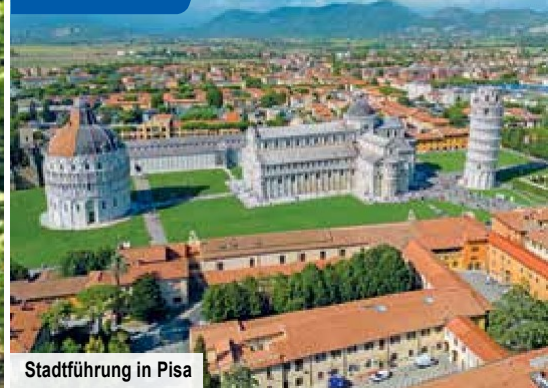
Stadtführung in Pisa