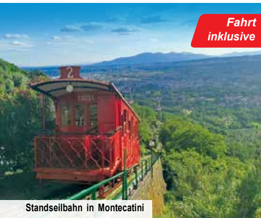
Standseilbahn in Montecatini