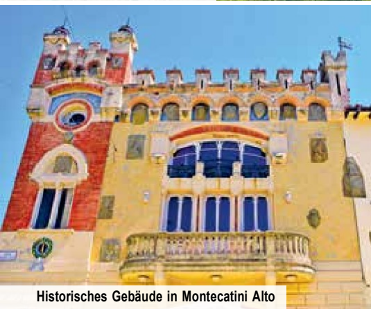
Historisches Gebäude in Montecatini Alto