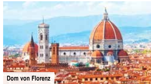
Dom von Florenz

Ganztagesausflug „Magisches Florenz“ inkl. Kopfhörersystem und Stadtführung € 79 p. P. Bei Vorabbuchung sparen Sie € 10 p. P. € 69 p. P.