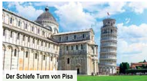
Der Schiefe Turm von Pisa

Ganztagesausflug „Städteperlen Pisa & Lari“ inklusive Stadtführung in Pisa und Besuch einer Käseerei mit Verkostung von 3 Käsesorten sowie einem Glas Wein in Lari € 79 p. P. Bei Vorabbuchung sparen Sie € 10 p. P. € 69 p. P.