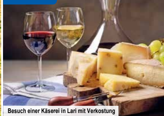
Besuch einer Käseerei in Lari mit Verkostung